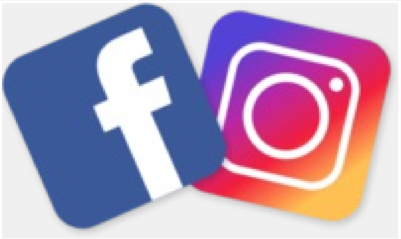
Facebook & Instagram

Erfahre alle Neuigkeiten zu den Themen Steuern, Wirtschaft, Recht sowie Informationen und Veranstaltungen unseres Hauses. „Gefällt mir“- Button betätigen auf www.facebook.de/awlsteuern oder folge uns auf www.instagram.com/awlsteuern